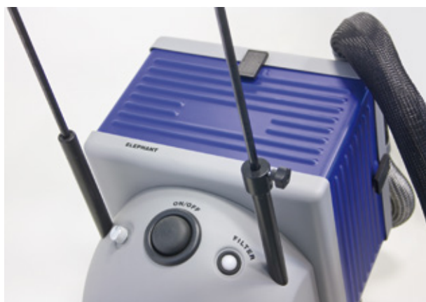
Absaug-, Filter- & Versorgungseinheit Suction, filter & supply unit