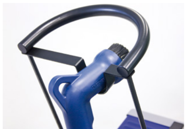
Praktische Handhabung des Reinigungssystems Usefull handling of the cleaning system